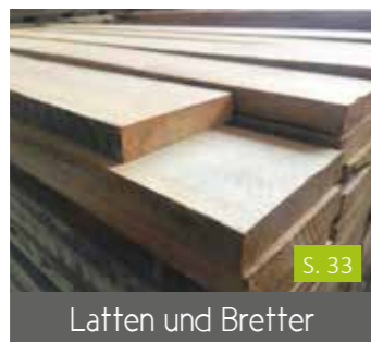
Latten und Bretter

unseren Rundhölzern oder konstruieren Sie einen stabilen Unterbau für Ihre neue Terrasse. Mit unseren Produkten können Sie sich auf Qualität und Langlebigkeit verlassen. Auch für DIY-Projekte sind unsere Hölzer bestens geeignet- Warum den Sandkasten für die Kinder oder das Hochbeet nicht einfach selbst bauen?